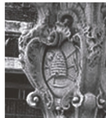
Plaza Constitución (Montevideo)

Ya desde su nombre genera polémica; popularmente se le conoce como Plaza Matriz, dado que está frente a la catedral Matriz, pero en esa lucha por el laicismo es que se trata de imponer el nombre Constitución. En los detalles quedan claros los elementos de la masonería. El escudo no coincide con el escudo nacional, sino que en la parte del cerro hay una fortaleza que simboliza la alquimia. El cerro es el agua, el caballo es el fuego, la balanza es el aire, el buey es la tierra. El sol representa el ser interno del hombre.