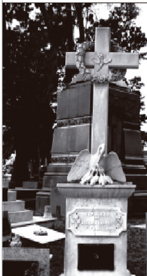
Detalle del grado Caballero Rosacruz (Cementerio Central)

Panteón Nacional Cementerio Central (Montevideo). En el friso se puede apreciar la alternancia de calavera y tibias cruzadas con relojes de arena aladas (podrían ser relojes de agua). Detalle del friso del Panteón Nacional del Cementerio Central (Montevideo).