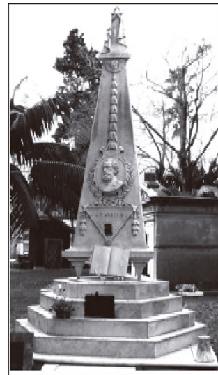
Tumba de José P. Varela en Cementerio Central (Montevideo)